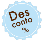
Tabela de Descontos

Caso o beneficiário não opte pelo plano de saúde visual 2 Para Ti, terá acesso a diversos descontos directos na aquisição de produtos e serviços.